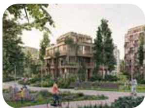
4 Nieuwe stadswijk bij Station Oost en de Vliert