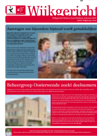
7 Gemeente Nieuws