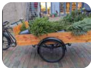
2 Kerstbomen reddingsactie