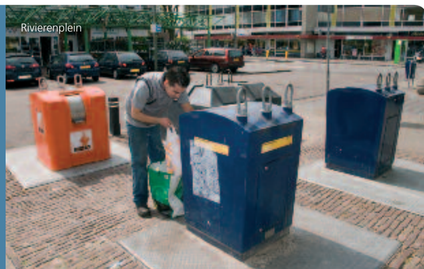
Een bewoner die weet hoe het hoort: afval hoort in de container.