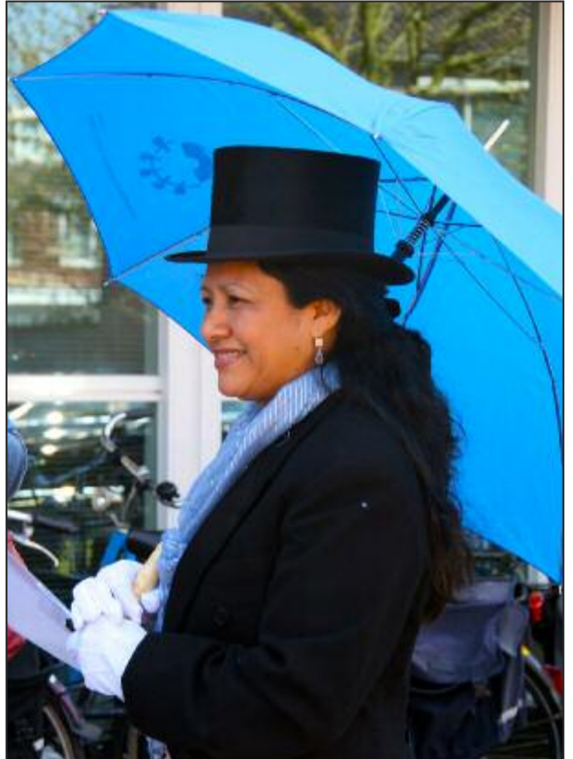
Door Ingrid Nijskens