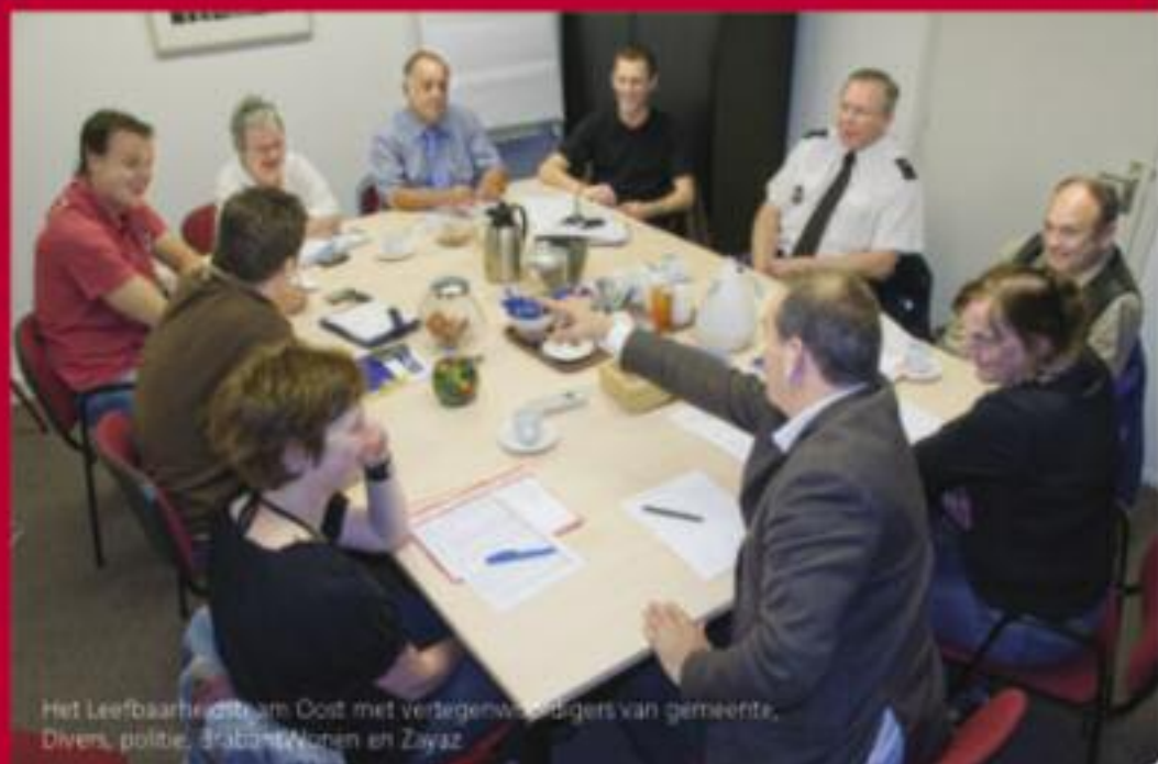
Het Leefbaarheidsteam Oost met vertegenwoordigers van gemeente, Divers, politie, Eikend Wonen en Ziyaz.

bewoners een wandeling door de wijk, om alles te noteren wat verbeterd kan worden. Wij kunnen niet alles oplossen. Maar samen alles in de gaten houden helpt wel.'