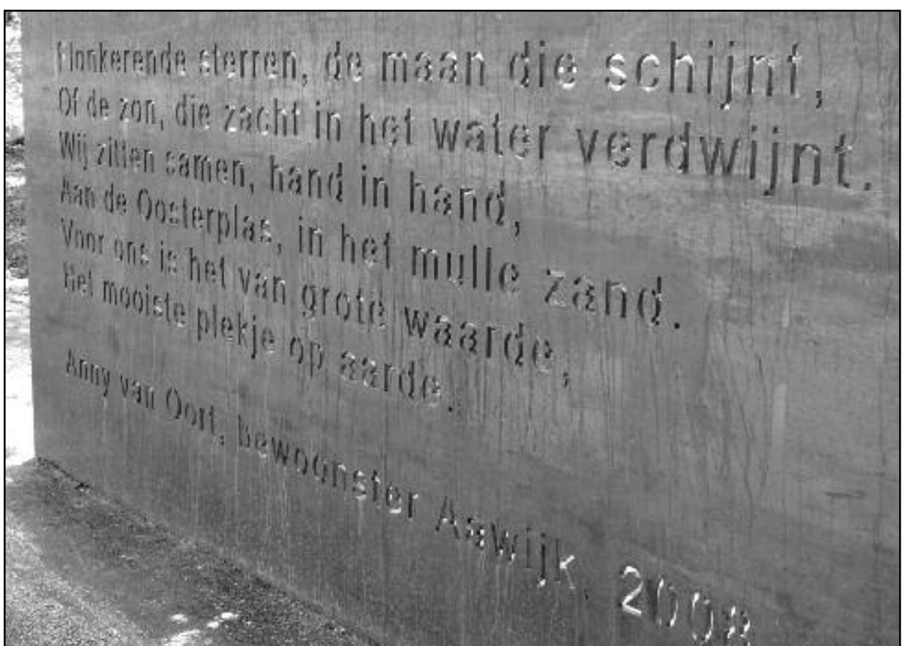
De Oosterplas, wat is het er verschrikkelijk mooi geworden! Niet in de laatste plaats door alle inspanningen van de Werkgroep Oosterplas. De kroon op het juweel Oosterplas is het gedicht van Anny van Oort, onze wijkdichteres [zie foto hierboven].

van 09.30u tot 15.00u: kinderkermis. Dus nogmaals, alle kinderen vanaf 3 jaar kunnen zich aanmelden op 31 augustus. En niet vergeten geld mee te brengen!