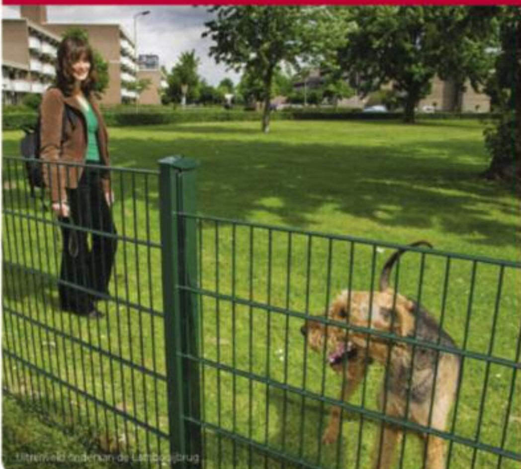
Uitrenveld onderaan de Lamboijbrug

Alle bewoners, zowel hondenbezitters als niet-hondenbezitters, zijn met hun suggesties welkom als het hondenbeleid op de agenda staat van de vergadering van het Wijkplatform Oost. Een concrete datum moet hiervoor nog worden vastgesteld.